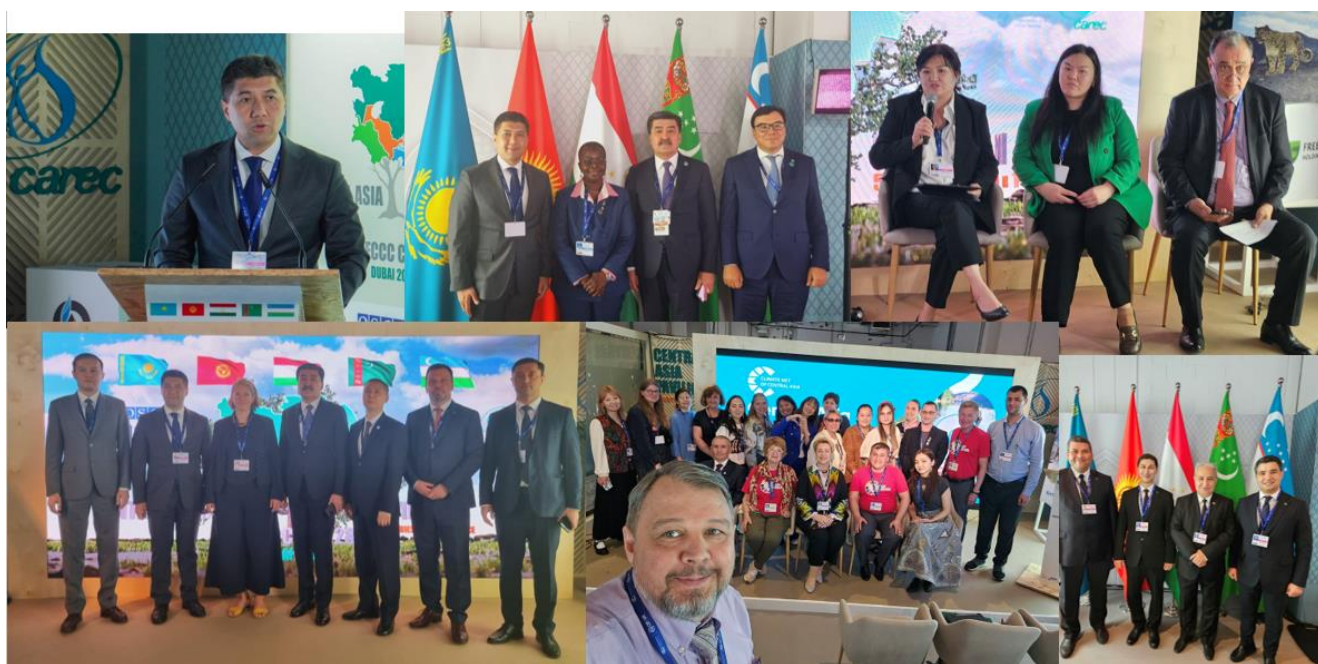
Рис. 1. Работа павильона стран Центральной Азии – РЭЦА

Все эти достижения были бы невозможны без активного развития партнерских отношений на всех уровнях, где важнейшая роль принадлежала павильонам. Павильон пяти стран ЦА был динамичным центром обмена идеями и опытом, площадкой для обсуждения вызовов и возможностей, связанных с адаптацией, низкоуглеродным развитием и финансированием, см. рис.1. Его посетили более 3 000 человек, было проведено 44 мероприятия (side events), где выступило более 270 представителей государственных органов стран ЦА и других государств, руководителей и экспертов из более 30 международных структур, большое число представителей бизнеса и НПО. В переговорной комнате павильона прошло более 30 встреч по развитию партнерства.